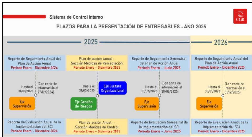
Gráfico N° 1 Plazos para la presentación de entregables del SCI – periodo 2025, según los ejes