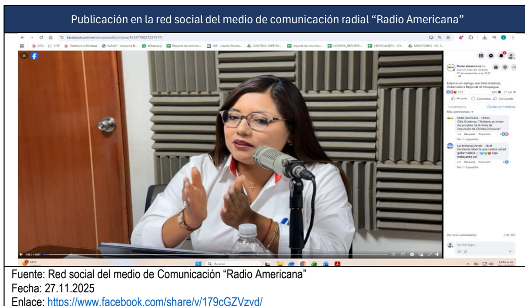
Imagen n.º 1 – Captura de pantalla