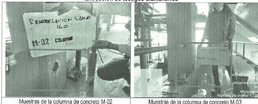
Imágenes n.ºs 4 y 5 Extracción de testigos diamantinos