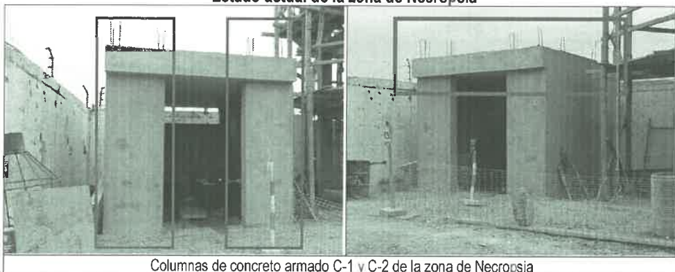
Columnas de concreto armado C-1 y C-2 de la zona de Necropsia