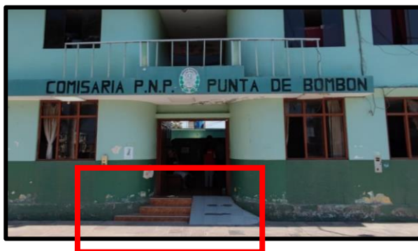
Ingreso a la comisaría cuenta con rampa pero sin pasamanos, barandas o parapetos