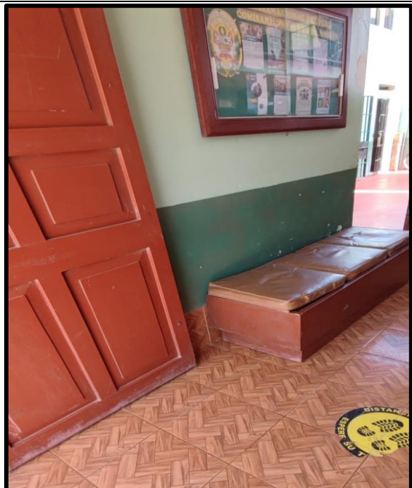
Zona de espera no tiene espacio reservado para silla de ruedas