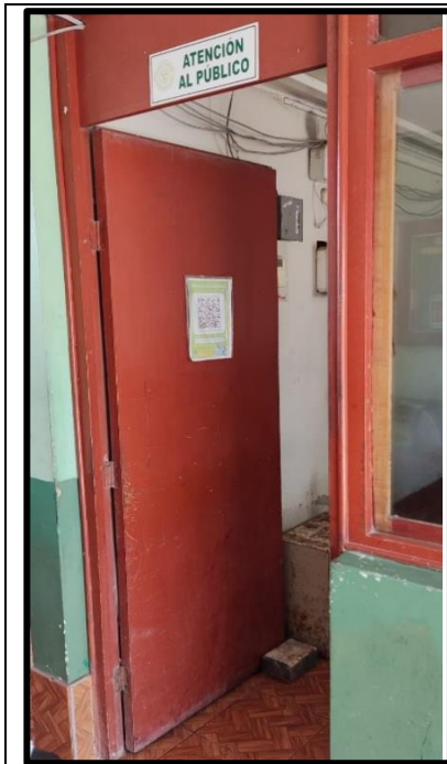
Puerta de oficina de atención al público

Verificación de atención para personas con discapacidad no cumple con medidas mínimas