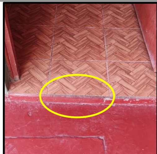
Desnivel en el desplazamiento a la oficina del Comisario