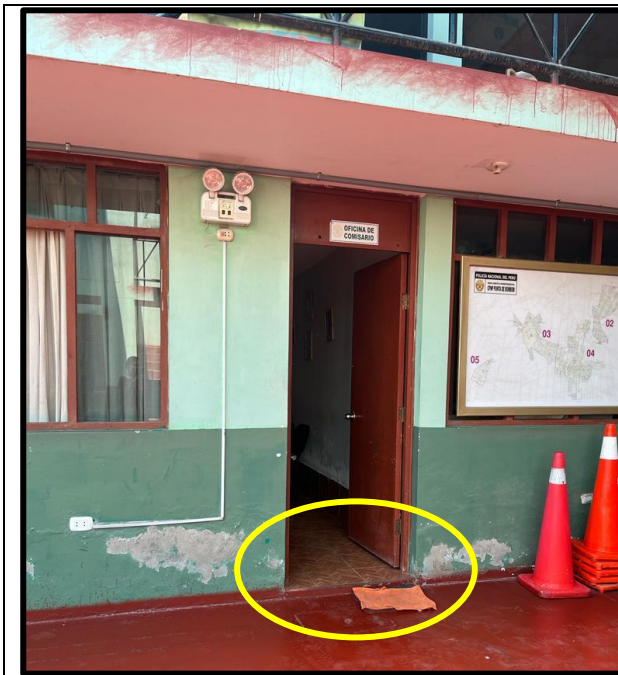
Desnivel en el desplazamiento a la oficina del Comisario