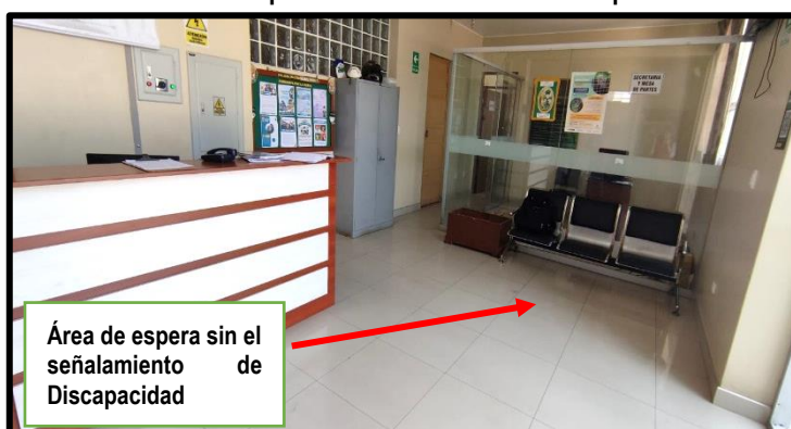
Toma Fotográfica n.º 3 Área de espera sin señalización de Discapacidad