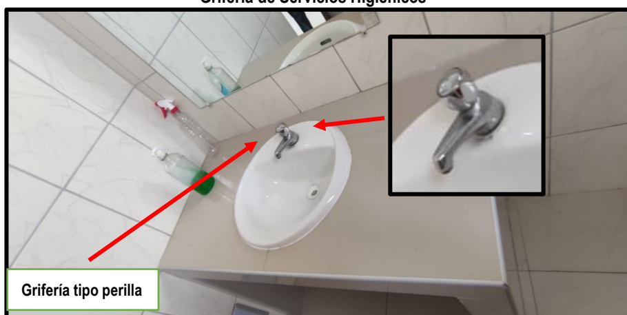
Toma Fotográfica n.º 3 Grifería de Servicios Higiénicos