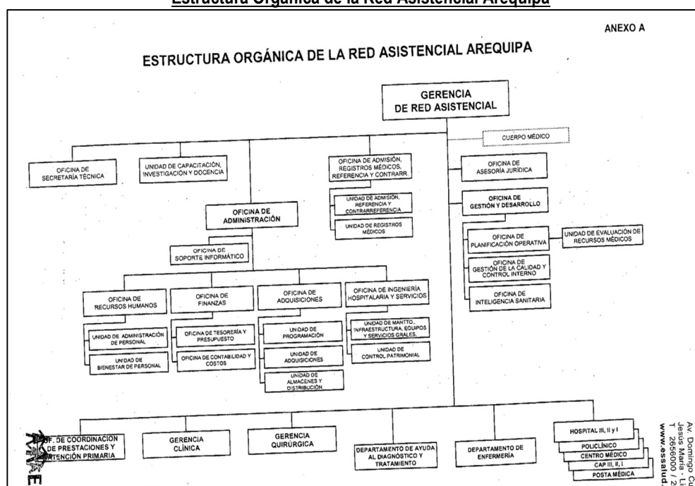
Gráfico n.º 1 Estructura Orgánica de la Red Asistencial Arequipa