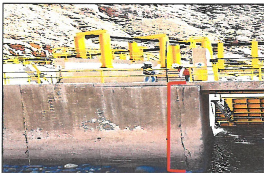
Imagen n.º 1: Se advirtió la existencia de fisuras en el muro de concreto lateral derecho de la compuerta n.º 4 de la Bocatoma de Otorá.