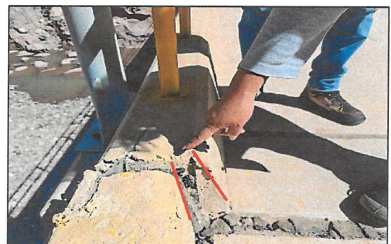
Imagen n.º 2: Se advirtió el desplazamiento de cinco (5) centímetros aproximadamente, entre la junta de la plataforma de la compuerta n.º 4 y el muro central de la Bocatoma de Otorá.