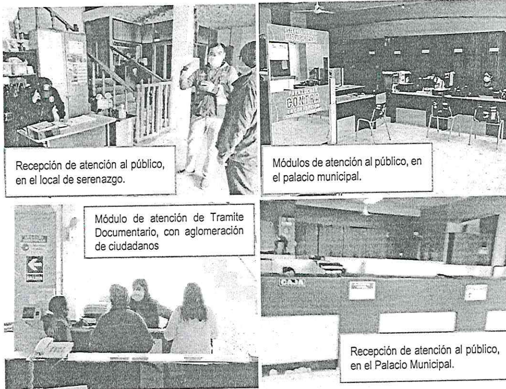
Recepción de atención al público, en el local de serenazgo.